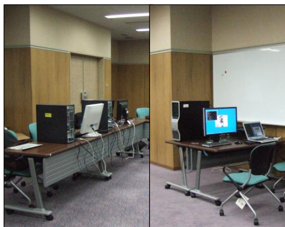
図1 コンテスト会場の様子