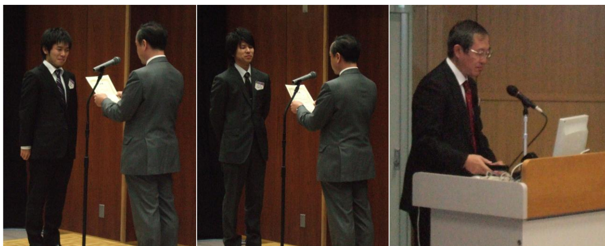
図3 表彰式と講評の様子